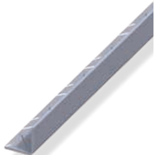
Winkel, innen, gleichschenkelig

Tipp zur eigenen Herstellung weiterer nützlicher Riffelblech-Profile: Ein Quadratrohr aus Riffelblech stellen Sie ganz einfach her, indem Sie zwei Quadrat-U-Profile ineinander verschachteln und vernieten oder verschrauben. Größere und noch stabilere U-Profile erhält man durch Vernieten oder Verschrauben zweier Winkel. Hierbei sind auch U-Profile mit verschiedenen hohen Schenkeln möglich. Ebenso können Sie T-Profile durch Verbinden zweier Winkel herstellen.