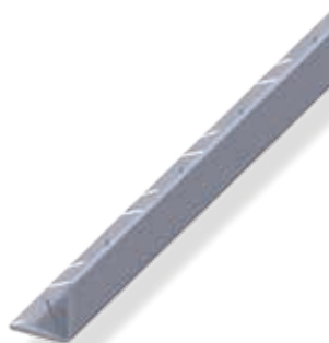
Cornière égale, intérieure

Astuce pour la fabrication d'autres profilés : il est très facile de fabriquer un tube carré en tôle grain de riz en imbriquant deux profilés en U carré l'un dans l'autre et en les rivetant ou vissant. Il est également possible d'obtenir des profilés en U plus grands et plus stables en rivetant ou vissant deux cornières. Des profilés en U inégaux ou des profilés en T peuvent également être fabriqués en assemblant deux cornières.