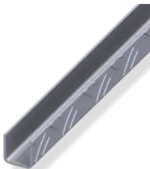
Profilé en U carré