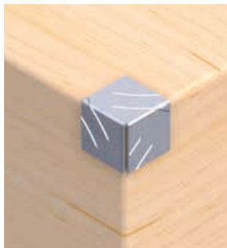
Angle de coffre